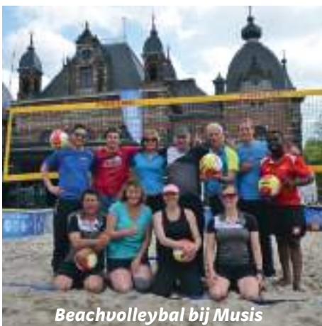
Beachvolleybal bij Musis