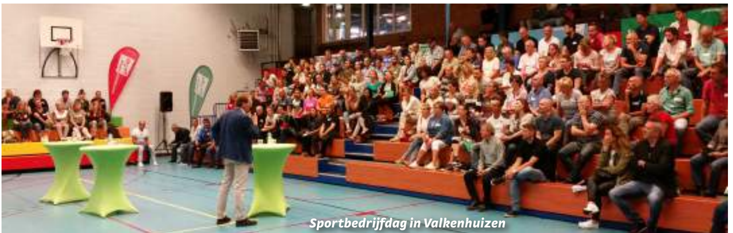
Sportbedrijfdag in Valkenhuizen