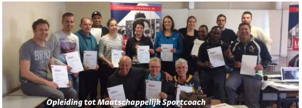
Opleiding tot Maatschappelijk Sportcoach