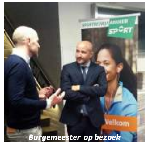
Burgemeester op bezoek